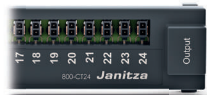
Strommessmodul 800-CT24 Artikel-Nr.: 5231247