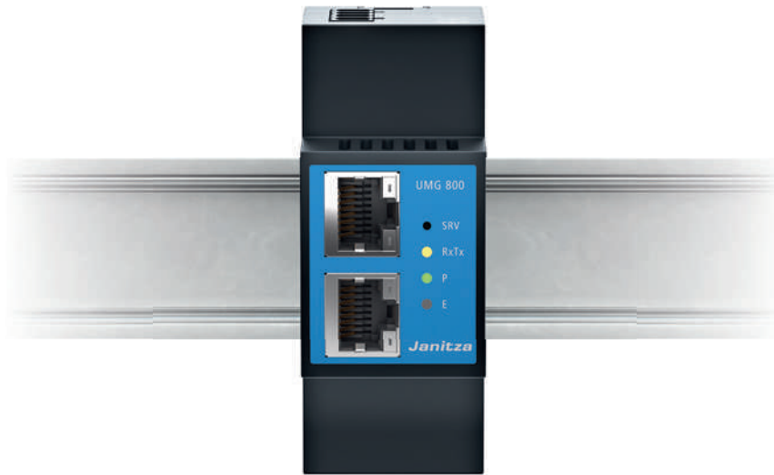
Basisgerät UMG 800 Artikel-Nr.: 5238001