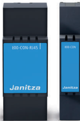
Übergabemodul 800-CON-RJ45 Artikel-Nr.: 5231242